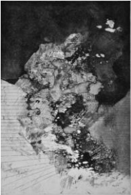
Donatello Laurenti, "Simbiotico ipogeo", 2019, acquaforte e acquatinta su rame, mm 300x200 (560x380) © Donatello Laurenti