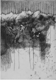
Donatello Laurenti, "Pescatori di scaglie", 2018, acquaforte e acquatina su ottone, mm 126x89 (380x280) © Donatello Laurenti