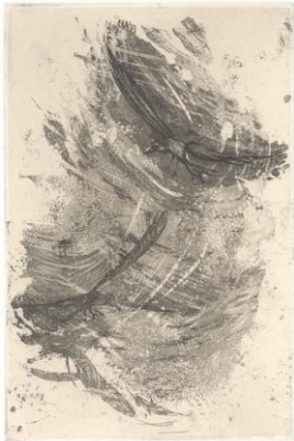
Claire Zahnd (*1951) "Petits fragments de ciel", 2023 acquaforte e acquatinta su rame 200 x 150 / 380 x 280 mm edita dall'AAAC quale stampa n. 118 Atelier Calcografico, Novazzano, ottobre 2023 © Claire Zahnd