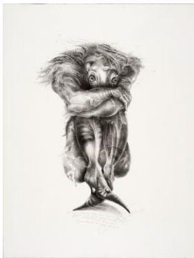
“Les soucis”, 1996 litografia, 700 x 500 mm (foglio) © Claire Zahnd