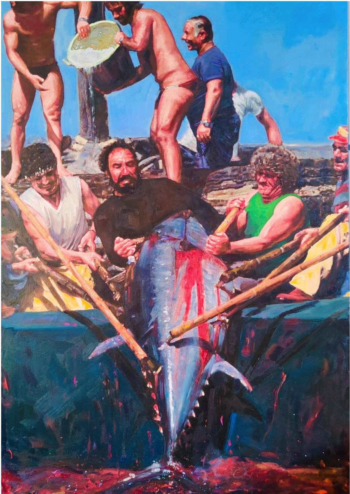
Red 2022 (part.)

Olio su tela, torcia bamboo con citronella, pigmento rosso su parete e scatolette di tonno.