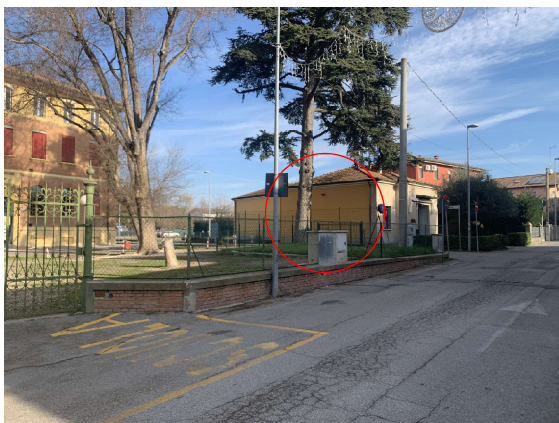
Percorso di avvicinamento alla nuova sede (cerchiata in rosso) con indicazione della posizione della attuale sede (cerchiata in giallo)