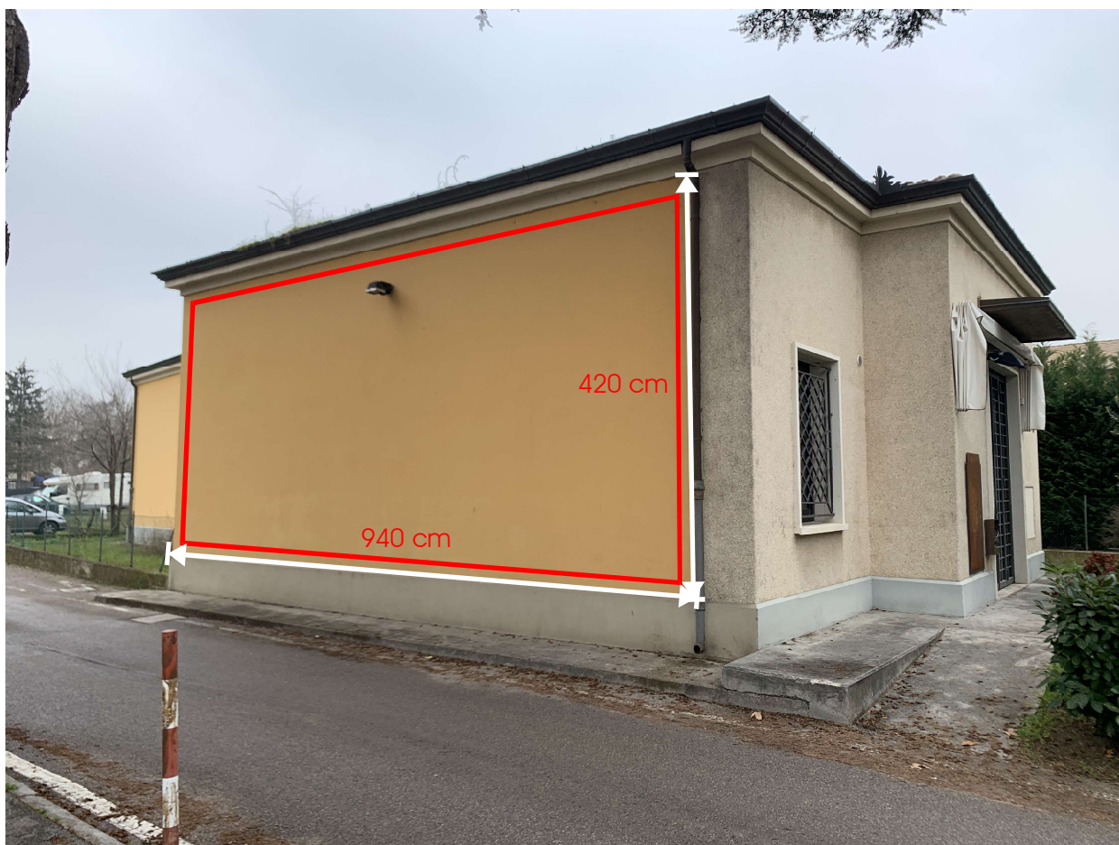
Parete della nuova sede di Farmacia Alberino destinata ad ospitare il murale