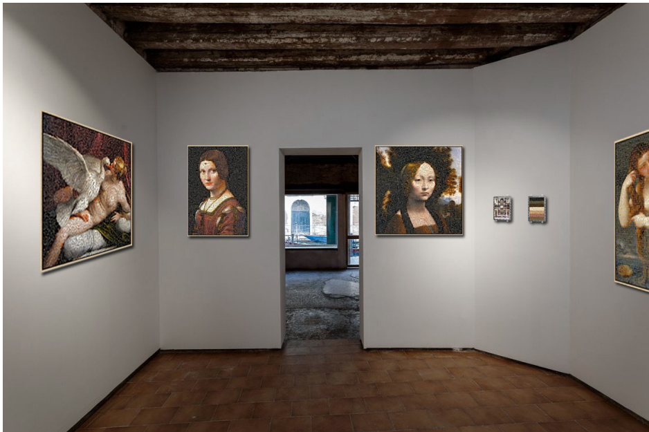
The Puzzling Classics Show | simulazione allestimento mostra stanza B