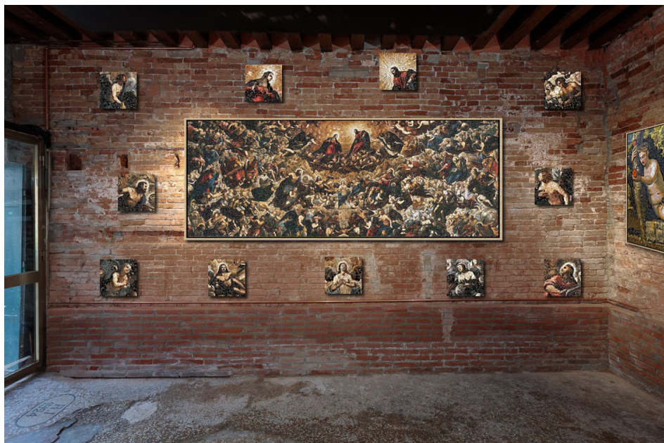
The Puzzling Classics Show | simulazione allestimento mostra stanza A