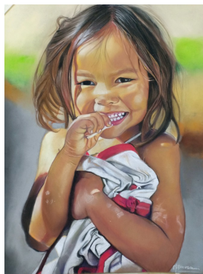
IL VOLTO DELLA GIOIA 2020, pastello secco su Pastelmat, 30x40cm