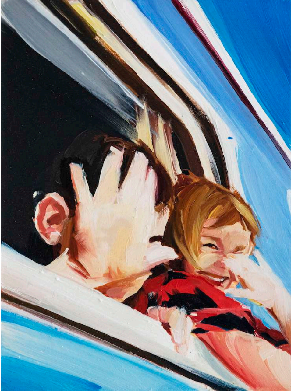
Andrea Fontanari, Confinement III , 2021, olio su carta (300g), 27,5 x 20,5 cm