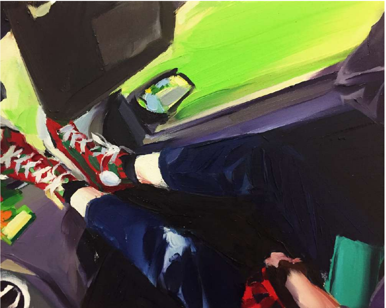
Andrea Fontanari, Untitled (Ford) , 2021, olio su tela, 24 x 30 cm