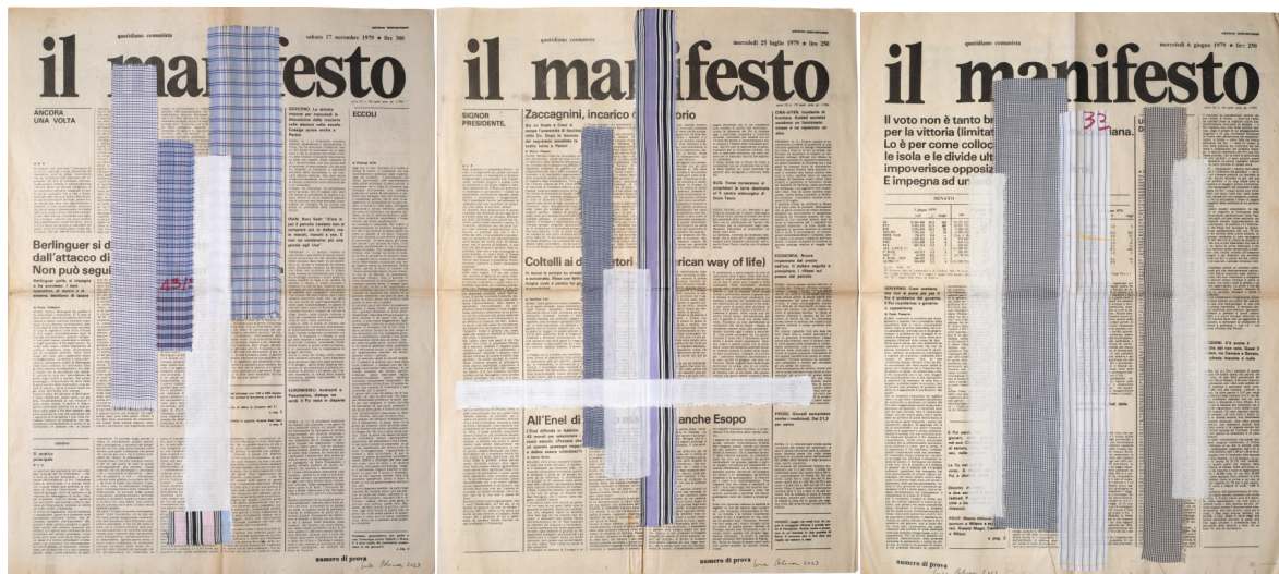
"Numero di prova 1" di Luca Blumer

Le opere, dopo Artefiera, entreranno ufficialmente nella grande collezione do ut do , per poi essere assegnate a collezionisti o musei a fronte di un contributo di sostegno all'Associazione Amici della Fondazione Hospice MT. Chiantore Seràgnoli. L'intero ricavato verrà devoluto alla Fondazione Hospice . Come nelle passate edizioni, infatti, anche per il 2024 do ut do riunirà i generosi contributi di artisti, gallerie e collezionisti per sostenere concretamente la missione della Fondazione Hospice MT. Chiantore Seràgnoli dedicata all'assistenza e cura di pazienti affetti da malattie inguaribili e delle loro famiglie e alle attività di formazione e ricerca in medicina palliativa all'interno del Campus Bentivoglio.