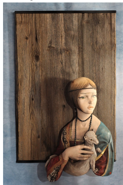
DAMA CON L'ERMELLINO 2020, legno di cirmolo policromo, 90x100x13 cm