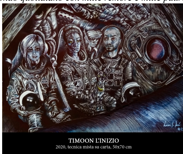
TIMOON L'INIZIO 2020, tecnica mista su carta, 50x70 cm