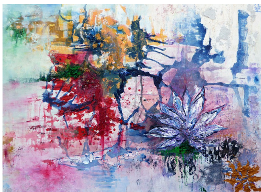
STATI D'ANIMO 2021, tecnica mista, 80x60x3.5cm