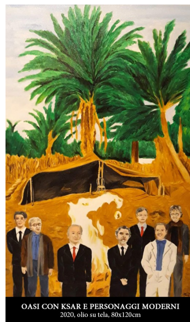
OASI CON KSAR E PERSONAGGI MODERNI 2020, olio su tela, 80x120cm