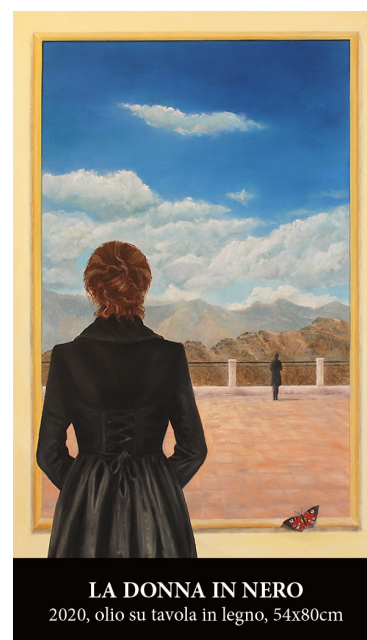
LA DONNA IN NERO