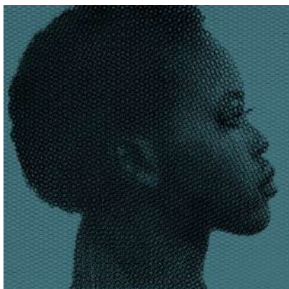
titolo: Wendy anno:2022 tecnica: rete metallica intagliata a mano misura: 95x95cm