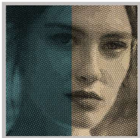
titolo: Elena - movimento 031025 anno: 2022 tecnica: rete metallica intagliata a mano su fondale colorato anno: 95x95