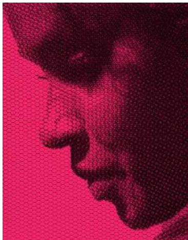
titolo: Dixie- movimento 020935 anno: 2022 tecnica: rete metallica intagliata a mano misura: GT220147