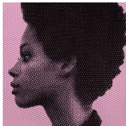
titolo: Debby - movimento 010939 anno:2022 tecnica: rete metallica intagliata a mano misura: 95x95 cm