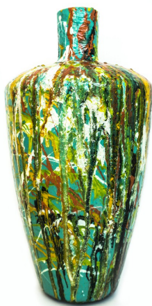
DOPPIA FACCIA (2019)

Vaso in vetro lavorato con resina epossidica, coloranti, resina poliuretanicca; realizzato con pennello, spatola e siringa; 50x27cm