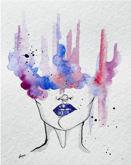
NEL MIO LUNAPARK 2020, china e acquerello su carta cotone 300gr, 32x21 cm