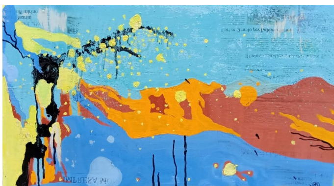
VIRUS 2020, olio su tela, 64x73cm