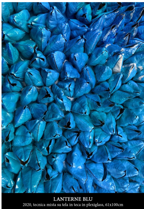
LANTERNE BLU 2020, tecnica mista su tela in teca in plexiglass, 61x100cm