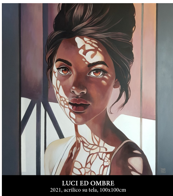
LUCI ED OMBRE 2021, acrilico su tela, 100x100cm