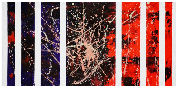
TEXTURE 2020, acrilico su tela di cotone, 60x30x4cm

L'arte riesce sempre a coinvolgere e a fare emozionare, riesce a trasferire nel fruitore percezioni visive e sensoriali travolgenti, cattura e conquista il cuore e la mente, attrae l'animo e suscita pensieri e riflessioni di spessore. Questa portata così articolata e sfaccettata, che l'arte da illo tempore possiede e sviluppa attraverso il suo humus fertile e fecondo che gli artisti coltivano e conservano nelle loro opere diffondendolo e facendolo proliferare, è un concetto molto sentito da