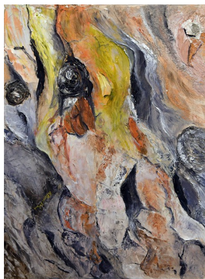
CORTECCIA TINGERINA 2019, tecnica mista, 30x40cm