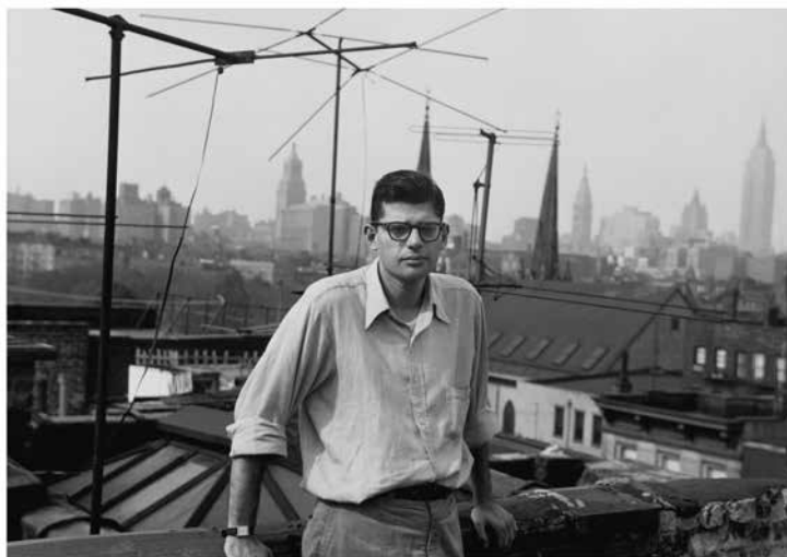
Portrait of Ginsberg on the roof of his apartment, New York City, 1953, by American photographer George Lawrence. Allen Ginsberg.

La fotografia in versi di una febbrile voglia di essere vissuti, del senso di appartenenza e di non rinunciare al desiderio e al bisogno di rivolta di un'intera generazione, la Beat Generation . La Nuova Bohemia la chiamavano, che già dagli abiti emergeva come sovvertimento di una società opprimente, conservatrice, conformista e collettivista. Jeans azzurri, maglioni, giacconi di cuoio e quegli impermeabili consunti, emblema della generazione hipster, i cui protagonisti non sono accademici o scrittori professionisti aggrappati ad un impiego accontentandosi della routine familiare, ma giovani figli di un mal du siècle che crea sgomento, inquieta. In perpetua ricerca di una raison d'être , credono nella vita ma respingono i sistemi morali e sociali precostituiti, vogliono scoprirne da sé dei nuovi sperando di trovarli più efficienti.