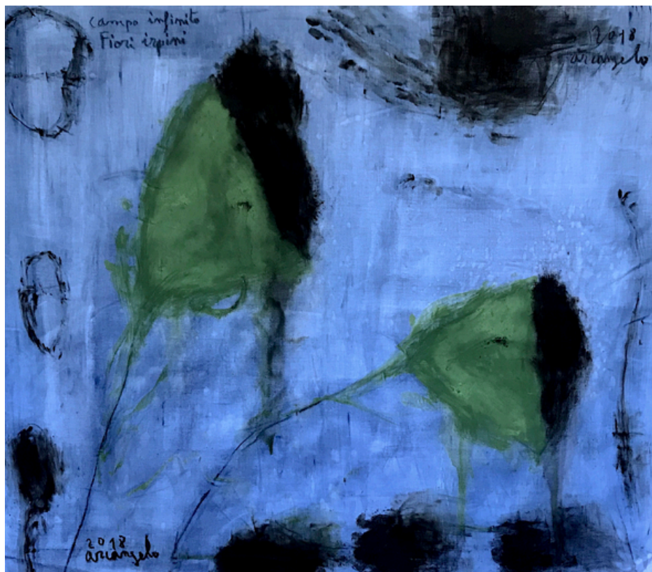
Arcangelo Campo Aperto Fiori irpini, 2018 Tecnica mista su tela - cm 90 x 104

Oltre alle numerosissime mostre personali e collettive nei più importanti centri italiani e internazionali negli anni sono stati editi numerosi volumi monografici e libri sulla sua arte anche in collaborazione con diversi poeti italiani tra cui Alda Merini, Maurizio Cucchi, Maurizio Medaglia.