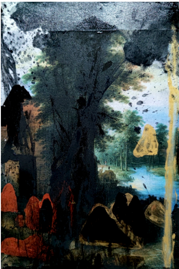
Arcangelo Paesaggio 2022 Tecnica mista su tela - cm 30 x 20

Per la Galleria Mazarine Variations, Arcangelo ha progettato una mostra radicalmente e profumatamente fiorita e drammaticamente lignea e flessuosa: "Fiori Irpini", "Fiori di Croco", e "Ulivi" tele nate nel suo studio di San Nazzaro in provincia di Benevento, luogo, per l' artista, ideale , in cui sempre trova radici per le sue opere. Saranno esposte anche piccole tele, "Paesaggi", un rimando sognante e poetico della tradizione pittorica del paesaggio, rivista da Arcangelo, e come piccole case sacrali, le preziose ceramiche, "Casa Dogon", che saranno il luogo intorno al quale vive il suo mondo visionario e terroso, ceramiche nate per il suo forte legame alla terra africana, meta di tanti suoi viaggi, che, per atmosfere e odori, è così vicina a quel sud dell'Italia a lui caro.