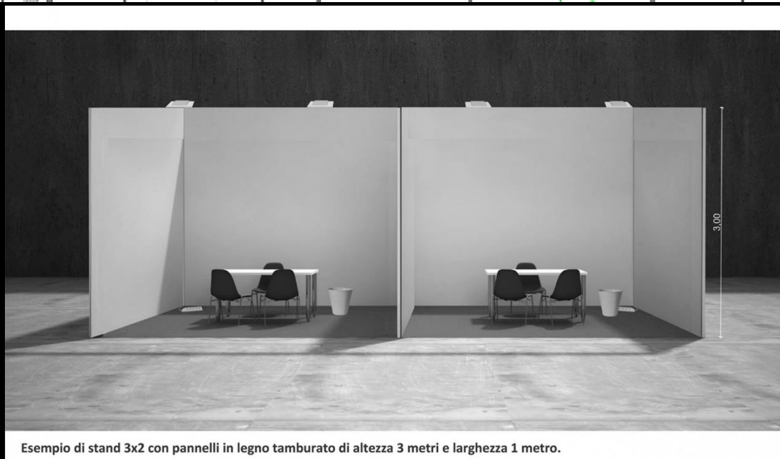
Esempio di stand 3x2 con pannelli in legno tamburato di altezza 3 metri e larghezza 1 metro.