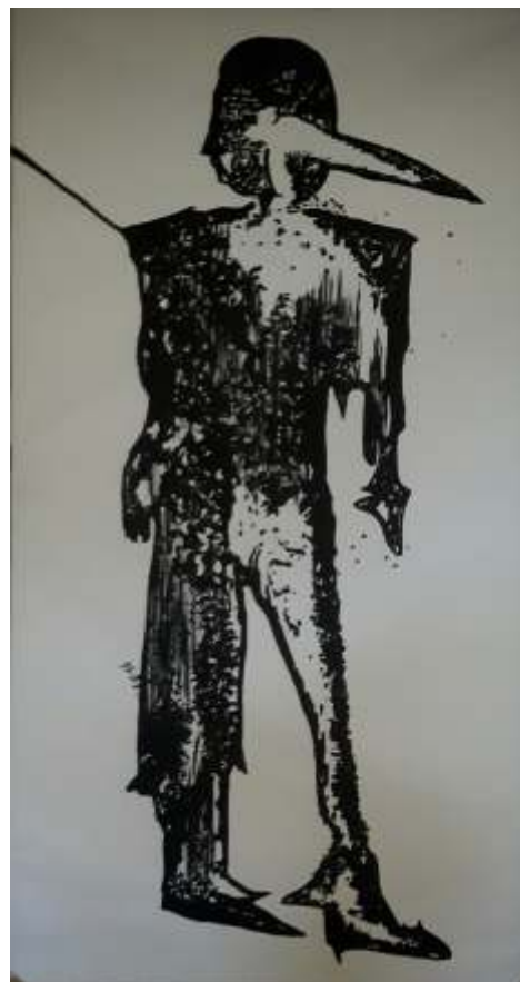
Ruvèn Latiani: corpoalchemico-di-pinocchio (2) acrilico su tela con elementi vegetali (210 x 100)