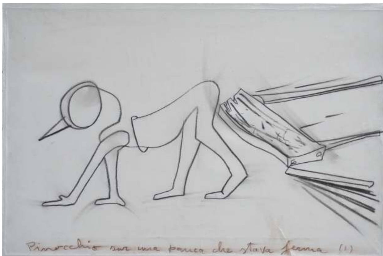
Ruvèn Latiani: Pinocchio sur una panca che stava ferma (1) carboncino su carta montata su tela (40 x 60)