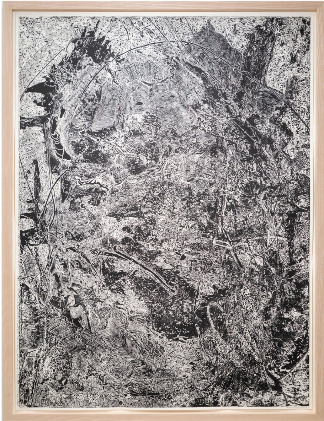
The material, 2022, 146cmx106cm, bois gravé sur papier Hahnemühle 300gr