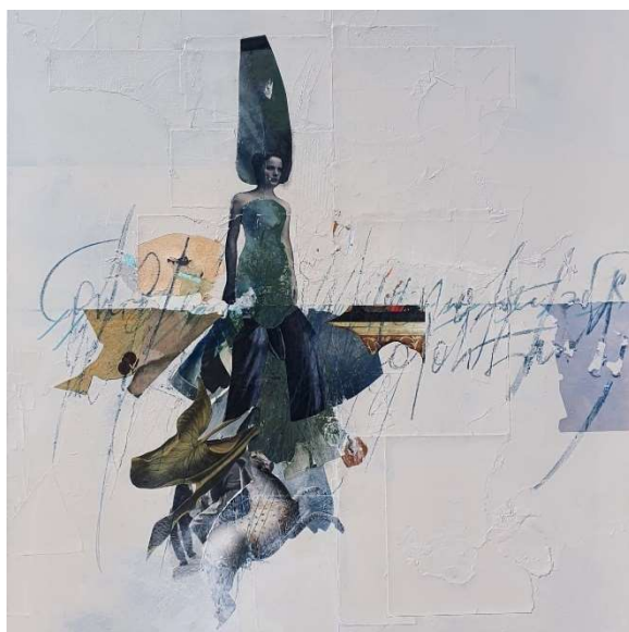
[Bianco - 150 x 100 collage su tela mix media 2021]

ArtSharing Roma presenta la mostra di Simona Gasperini