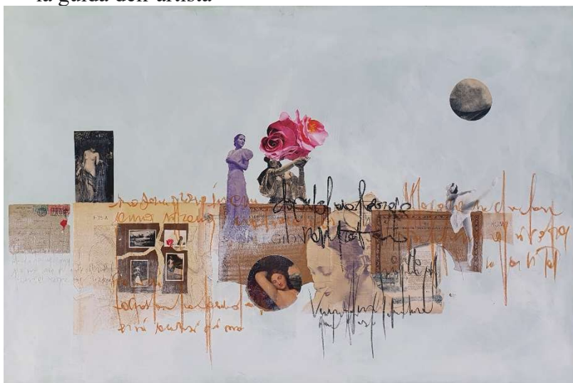
[Roma - 100 x 150 collage mix media su tela 2019]

Per questo la mostra si concluderà con un workshop aperto a chi, come lei, si voglia cimentare in questa bellissima arte dalle radici antiche , declinata in straordinaria modernità. Seguirà alla mostra “La stanza di Emily” un workshop di collage di dieci settimane (circa 30 ore) sotto la guida dell'artista