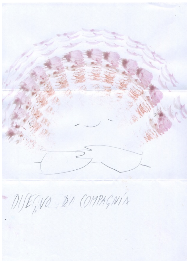
Lisa Ponti, disegno su carta cm 21x29,7