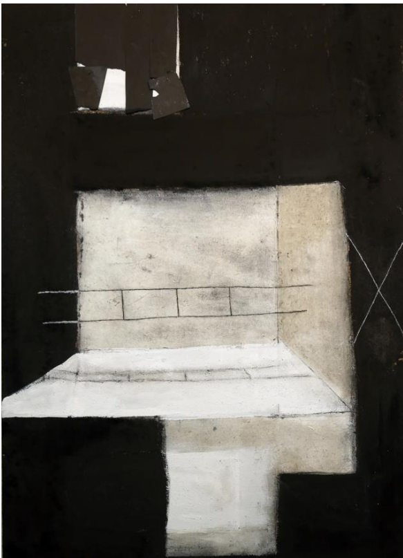
Lorenzo Mazza, Ritornare nel tempo, 2022, ossidi su tela, 140x100 cm